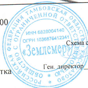
Схема составлена ООО "Землемер"