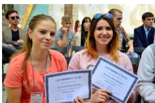
Слет для молодежи