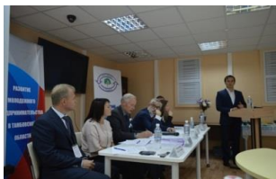
Региональный этап всероссийского Конкурса «Молодой предприниматель России»