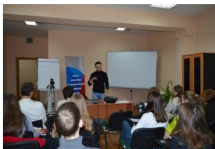
Школа «Основы молодежного предпринимательства»